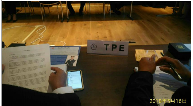
會議依據奧會模式進行