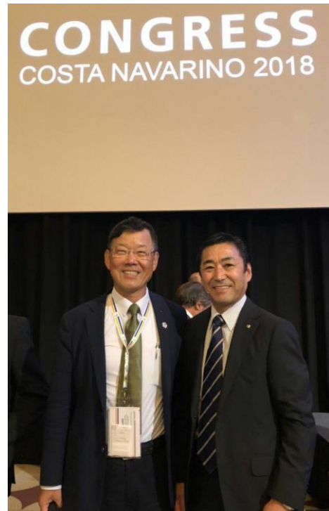
會後與新任會長合影