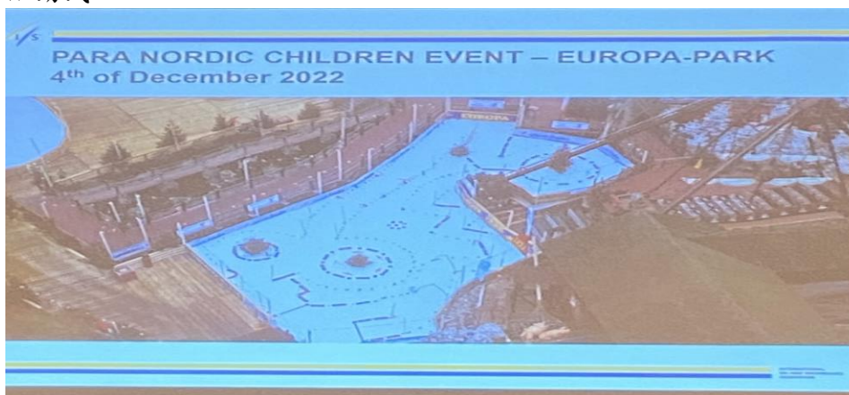
帕拉雪上運動的推廣活