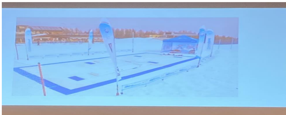
活動式 Snow Park